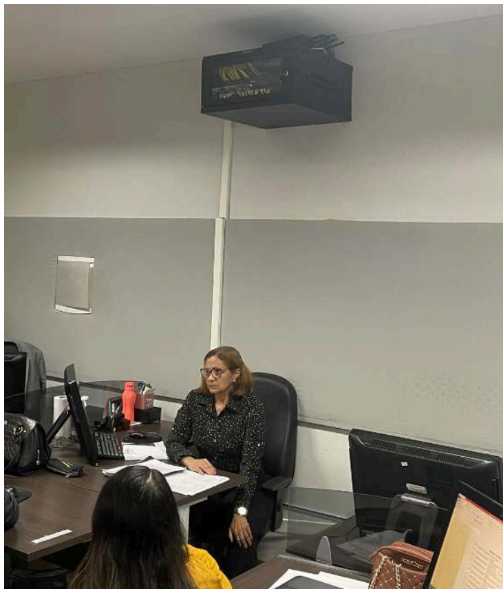
Figura 4: aparelho de internet.

Avenida FAB, nº 285 – Central – CEP 68.900-073 – Telefone: (96) 3223-3077 – Macapá – Amapá