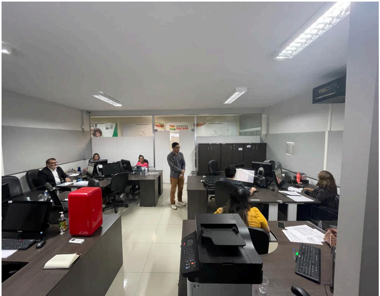
Figura 1: área total da sala.

Um ponto importante é que notamos que o ambiente é pequeno, as “ilhas” estão muito próximas, com pouco espaço para circulação dos servidores, que eventualmente esbarram nas outras mesas e pessoas.