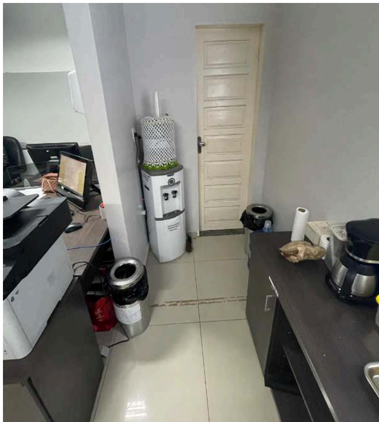
Figura 2: fundo da sala utilizado como “copa” e bebedouro.

Avenida FAB, nº 285 – Central – CEP 68.900-073 – Telefone: (96) 3223-3077 – Macapá – Amapá